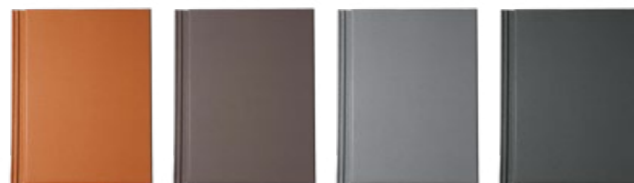
ceglany brąz kolonialny łupkowy grafitowy