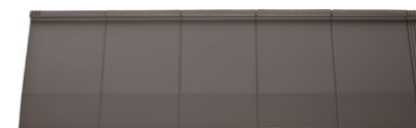
Szara Oliwka - Satyna (41)