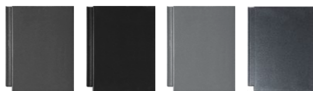
grafitowy czarny łupkowy szary kryształ