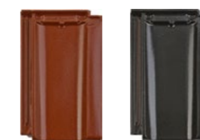
kasztanowy czarny błyszczący