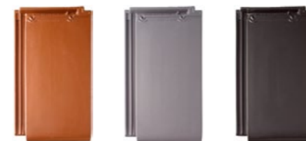
miedziany jasnoszary antracytowy