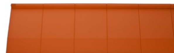
Ceglany - Satyna (35)