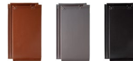
kasztanowy szary czarny błyszczący