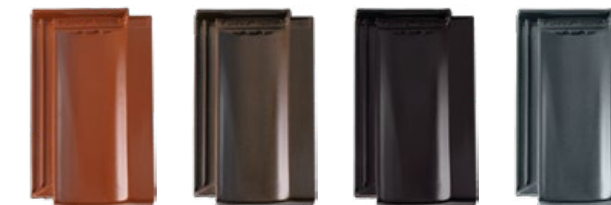
kasztanowy tekowy czarny błyszczący łupkowy błyszczący