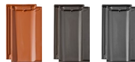
miedziany antracytowy łupkowy