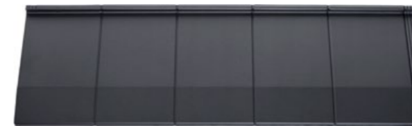
Grafitowy - Satyna (31)