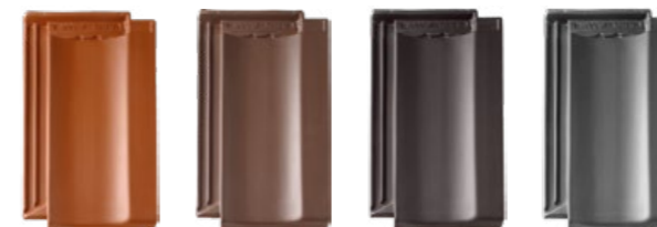
miedziany brązowy antracytowy łupkowy