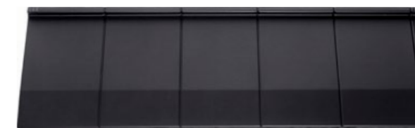
Czarny - Satyna (71)